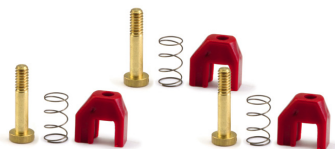
1228 Soft suspension kit for triangular motor support