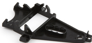
1257 Triangular anglewinder motor support medium black

4.2 E' ammessa solo la forcella originale 1234 rossa