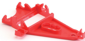
1259 Triangular anglewinder motor support xhard red

4.1 Sono ammessi solo i supporti 1259 anglewinder rosso e 1257 medium nero.