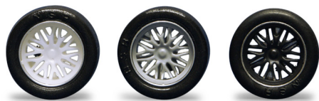
5422 - Ø 17mm BBS white